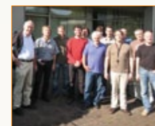
Die Führungscrew des Badischen Staatstheaters: Vom technischen Direktor über die Bühnenmeister, Abteilungsleiter, bis zum Beleuchtungsmeister.