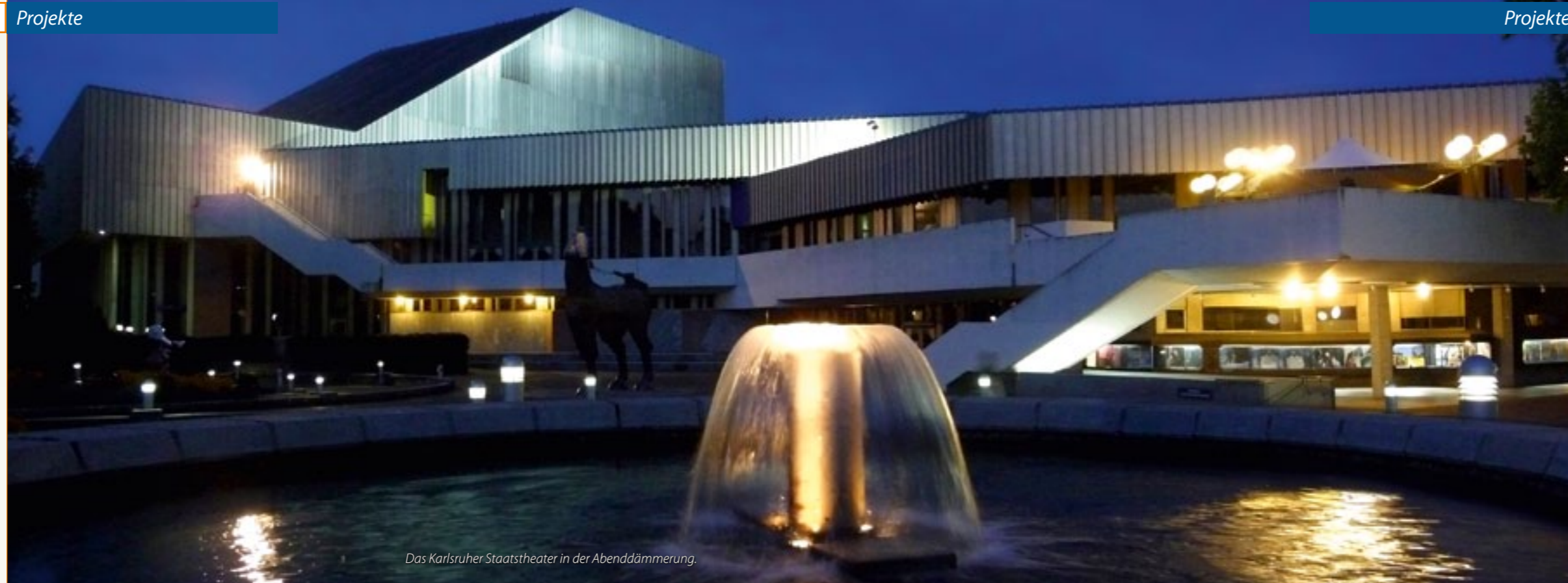
Das Karlsruher Staatstheater in der Abenddämmerung.