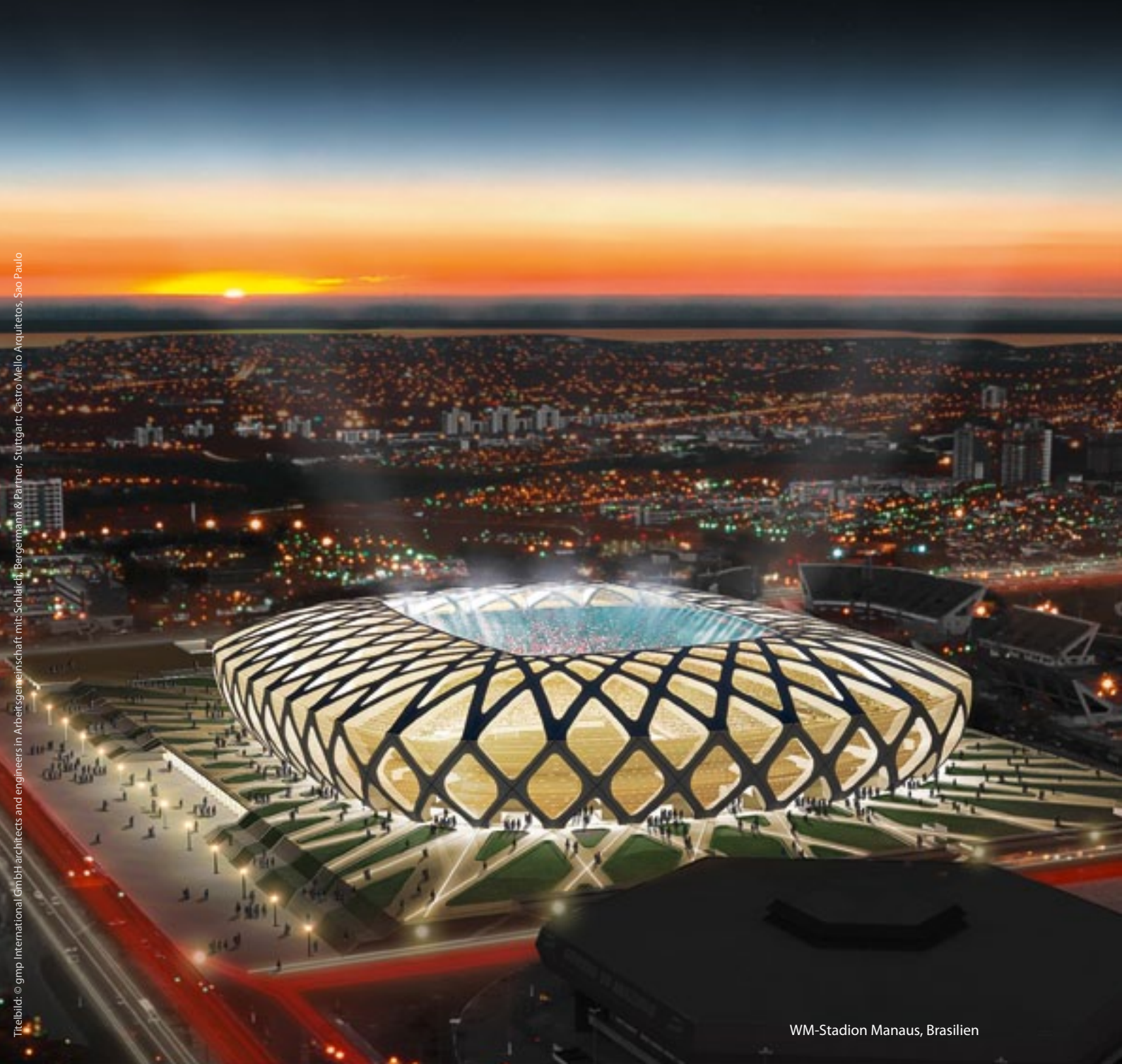
WM-Stadion Manaus, Brasilien

Treibbild: © gmp International GmbH Architects and engineers in Arbeitsgemeinschaft mit: Schlaich, Bergemann & Partner, Stuttgart; Castro Mello Arquitetos, Sao Paulo